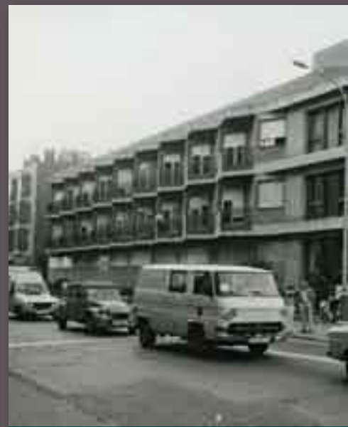
L'Hospital, amb les dues plantes construïdes aleshores