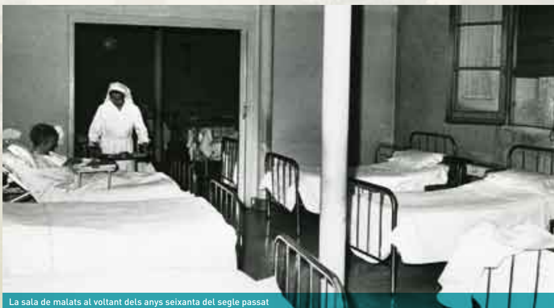
La sala de malats al voltant dels anys seixanta del segle passat