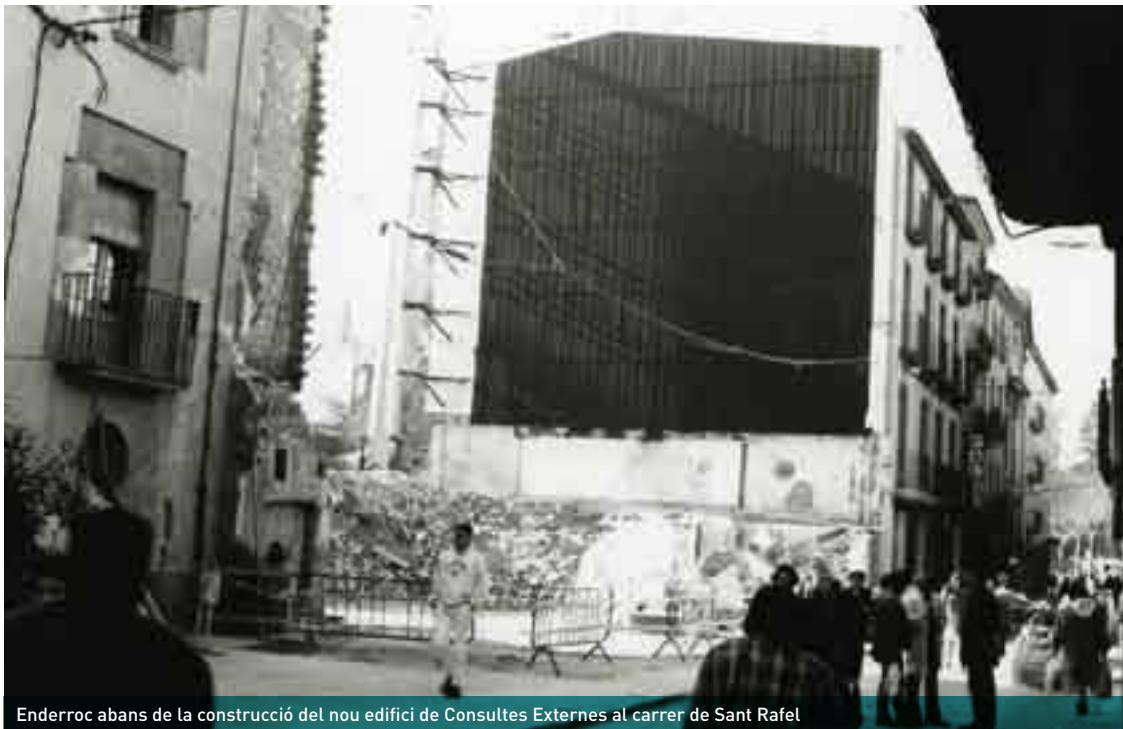
Enderroc abans de la construcció del nou edifici de Consultes Externes al carrer de Sant Rafel

i reforma dels serveis d'urgències, radiologia i admissions, nou edifici del carrer de Sant Rafel (consultes, arxius, rehabilitació, docència, vestuaris, magatzems) i altres millores i reformes.