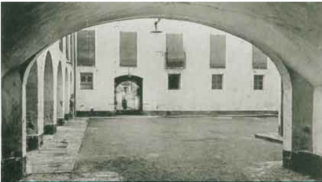
Pati i passatge de l'Hospital (1914 o 1915)

Durant el segle XVI la vila d'Olot experimentà un gran impuls demogràfic i urbanístic. Per això, la iniciativa privada promogué el trasllat i la construcció d'un nou hospital que s'ubicaria en la seva seu actual, amb façana principal al futur carrer de Sant Rafel, un punt clau en el trànsit de vianants (on començava el camí ral fins a Vic) i lleugerament separat de la nova trama urbana que es desenvolupava al voltant de l'actual plaça Major. El nou edifici es construí gràcies al mecenatge del notari olotí Miquel Març, el qual, l'any 1550, designà hereu universal (per la meitat del seu llegat) "lo hospital general dels pobres de la present vila de Olot". El mecenes morí el 21 de maig de 1553 i, un cop reunits tots els béns deixats, a partir de 1555 es començaren a adquirir els camps necessaris per a la nova edificació. En aquest cas es tractà d'un projecte ambiciós, amb un edifici de grans dimensions amb planta quadrangular, pati central i una façana monumental formada per diverses finestres i una gran porta, amb tots els elements motllurats i decorats. A partir de 1611 intervingué en la decoració i estructuració de la façana el cèlebre arquitecte i escultor Llätzer Cisterna, autor de l'espectacular claustre del convent del Carme.