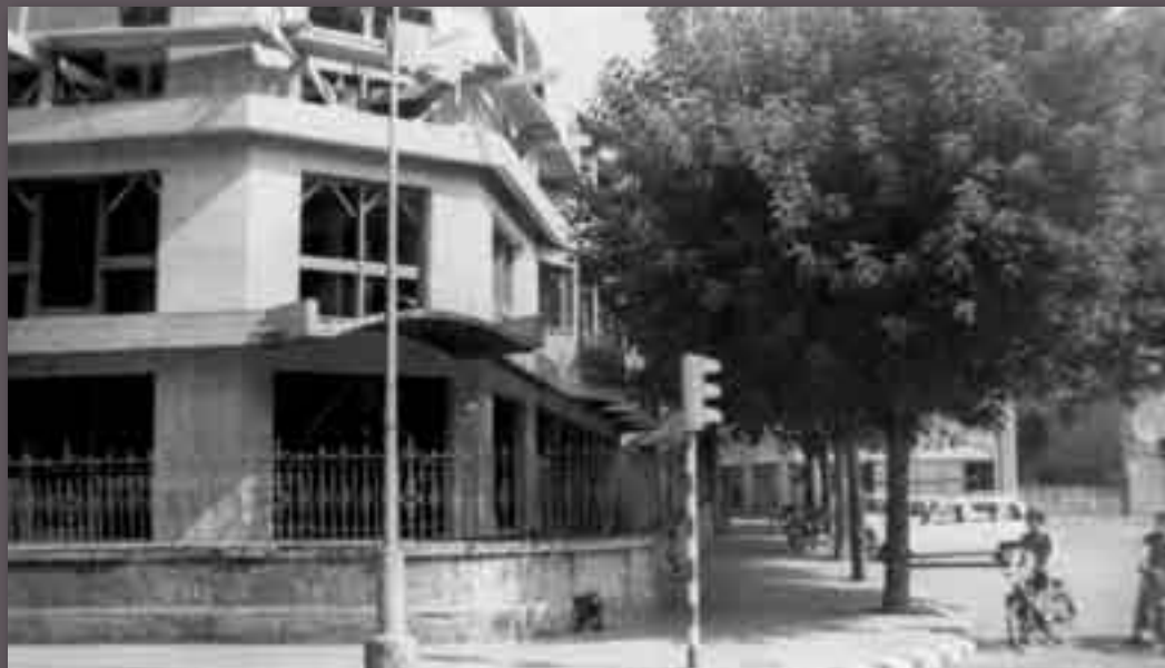
Construcció del nou pavelló de l'Hospital a principi dels anys 70 del segle passat