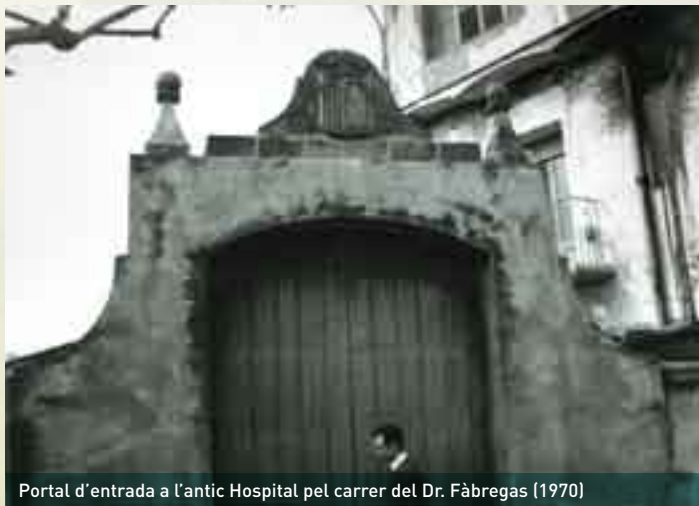
Portal d'entrada a l'antic Hospital pel carrer del Dr. Fàbregas (1970)

El segle XIX significà una època convulsa, de canvis i adaptació als temps de la primera industrialització. La capella de l'Hospital es reedificà del tot l'any 1843. A partir de 1847, les germanes carmelites de la Caritat, més conegudes per les "vedrunes", s'encarregaren d'atendre les dones que hi ingressaven. Per una "Real Orden" del 21 d'agost de 1860, fou declarat oficialment Hos-