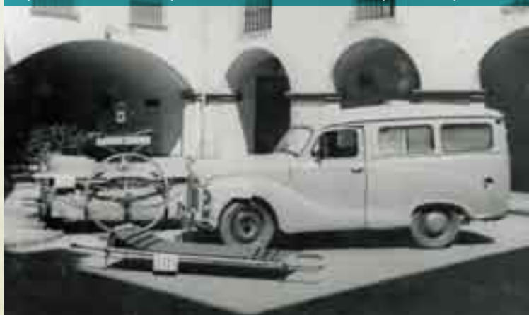
Exposició dels mètodes emprats en els trasllats dels malalts al pati de l'Hospital (1962)

En aquests primers anys, l'Hospital es mantenia mercès a donacions i almoines, i per aquesta raó el bisbe de Girona autoritzà, sovint, la celebració de misses especials i col·lectes per recaptar diners. Aquest sistema de finançament, basat en l'almoina, es mantindria al llarg dels segles fins al segle XIX, quan passà a ser un ens municipal. Durant la baixa edat mitjana es registra la donació de molt diversos llegats (camps, cases, rendes i tot tipus de béns) d'una geografia molt variada, ja que, so-