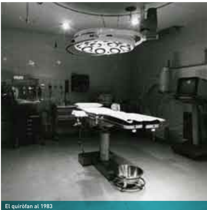
El quiròfan al 1983

En els anys següents les donacions també existeixen –i continuen existint avui en dia–, però el gran gruix de millores eren subvencionades per diferents institucions públiques, especialment pel Departament de Sanitat de la Generalitat de Catalunya. El Pla director, aprovat l'any 1986, marca les obres que s'han de realitzar durant els propers anys: servei de farmàcia, laboratori, àrea quirúrgica, la tercera planta d'hospitalització d'aguts, ampliació