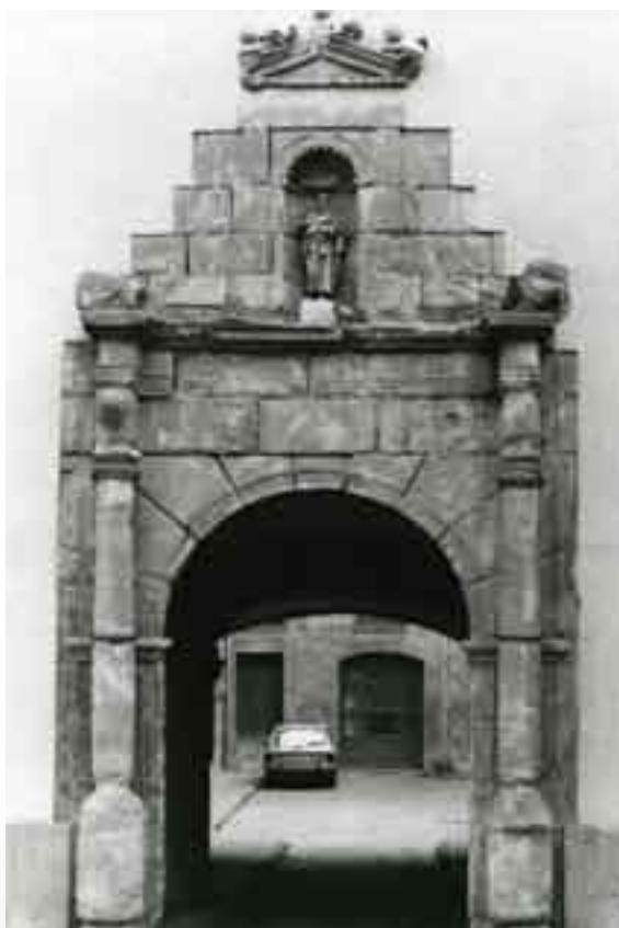
La portalada renaixentista de l'Hospital (s.XVII)

la més gràfica representació de la generositat dels olotins, qualitat que fou indispensable fins a la fi del passat mil·lenni, però que encara avui és vigent, si bé les donacions i llegats que encara rep l'Hospital Sant Jaume només es traslladen a l'opinió pública per mitjà de breus notícies, d'acord amb la discreció implícita en aquest tipus d'accions solidàries.