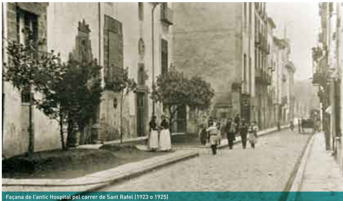
Façana de l'antic Hospital pel carrer de Sant Rafael (1923 o 1925)