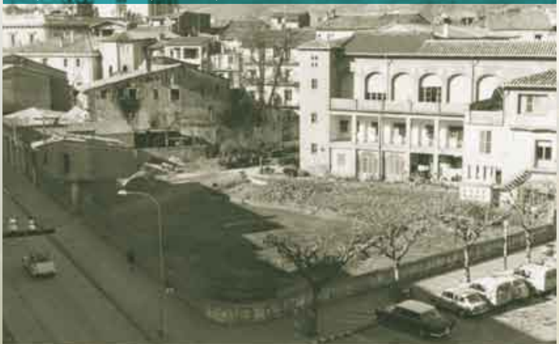
Terrenys on es va construir el nou pavelló de l'Hospital (1969)